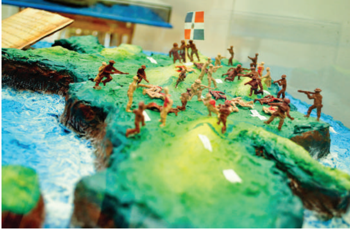
Los estudiantes realizaron diferentes maquetas

Con la celebración de conferencias, exposiciones, tutorías, talleres y un cine forum, donde los estudiantes participaron con alegría y entusiasmo, el Instituto Tecnológico de Las Américas (ITLA) celebró su Primera Feria Académica de Ciencias Básicas.